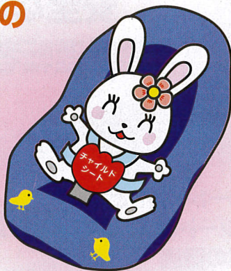
チャイルドシート着用 推進シンボルマーク 「カチャピヨン」